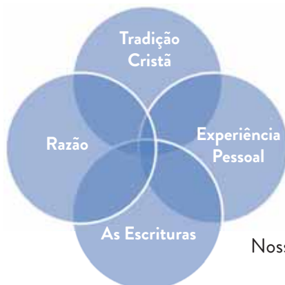
Nossas fontes de coerência teológica