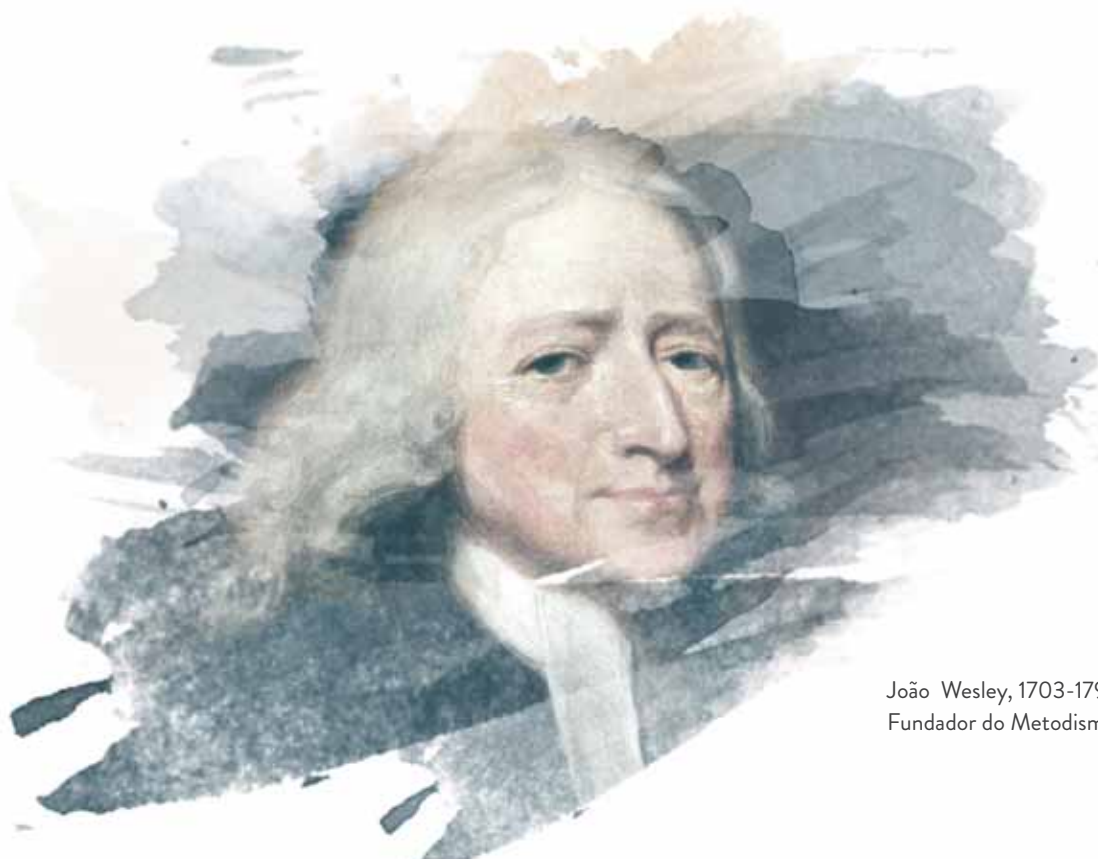
João Wesley, 1703-1791 Fundador do Metodismo